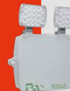
Luminaria de Emergencia Autónoma LED Línea Juruvaúva · CLK IP66 18W