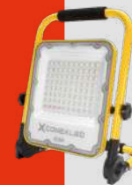
Reflector LED Portátil Autónomo Línea Guaraú · CLH-PA 50W y 100W Batería