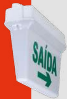
Bloque de Salida de Emergencia Autónomo Línea Juruvaúva · CLK-BADF IP66 3W