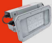
Reflector LED Blindado con Módulo de Emergencia Línea Guaecá · CLG-E(F) IP67 30W a 180W