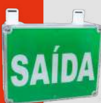
Bloque de Salida de Emergencia Autónomo Línea Juruvaúva · CLK-BA60 IP66 8W