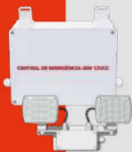
Luminarias de Emergencia LED Centralizadas para Bajas Temperaturas Línea Juruvaúva · CLK (CE) IP66 10W a 30W