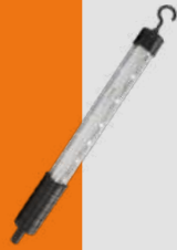
Luminaria LED Portátil Industrial Línea Tapirema · CLM IP66/IP67 18W