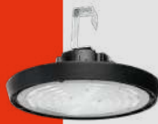
LED High Bay Industrial con Módulo de Emergencia Línea Picinguaba · CLI-E(F) IP66 104W a 193W