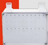
Bloque de Salida de Emergencia Autónomo Línea Juruvaúva · CLK-BA60BC IP66 8W