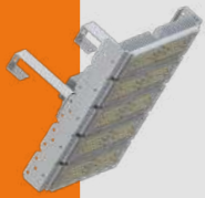
Luminaria High Bay Modular Línea Indaiá · CLF-HB(P) IP67 50W a 300W