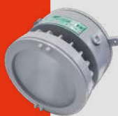
Luminaria LED para Áreas TGVP con Módulo de Emergencia Línea Tímbo · CLT-E IP66 29W a 192W