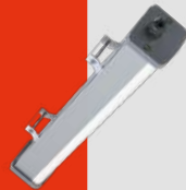
Luminaria LED Industrial Hermética con Módulo de Emergencia Línea Boracéia · CLB-E(P) IP66 20W a 90W